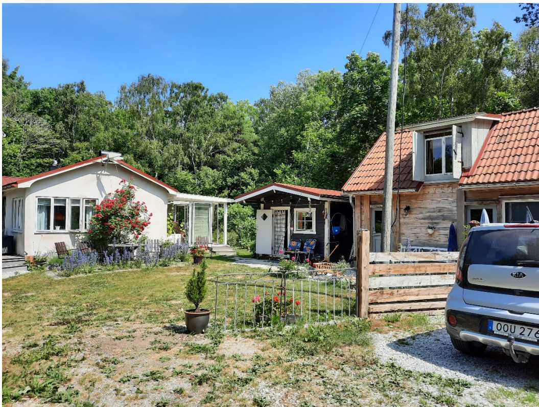
Foto 3: Bostadshuset, komplementbyggnad B och komplementbyggnad A